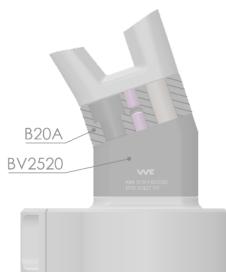
Optional: In kombination mit BV2520 Combined with BV2520