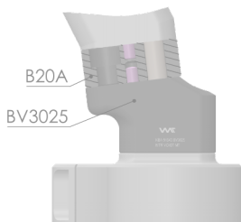
Optional: In kombination mit BV3025 Combined with BV3025